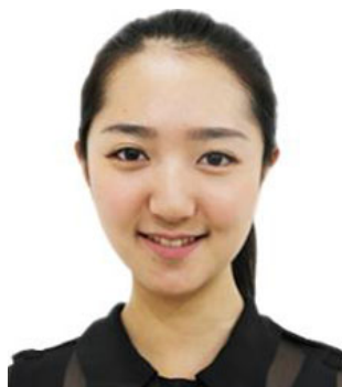
（证件照标准示例照片）